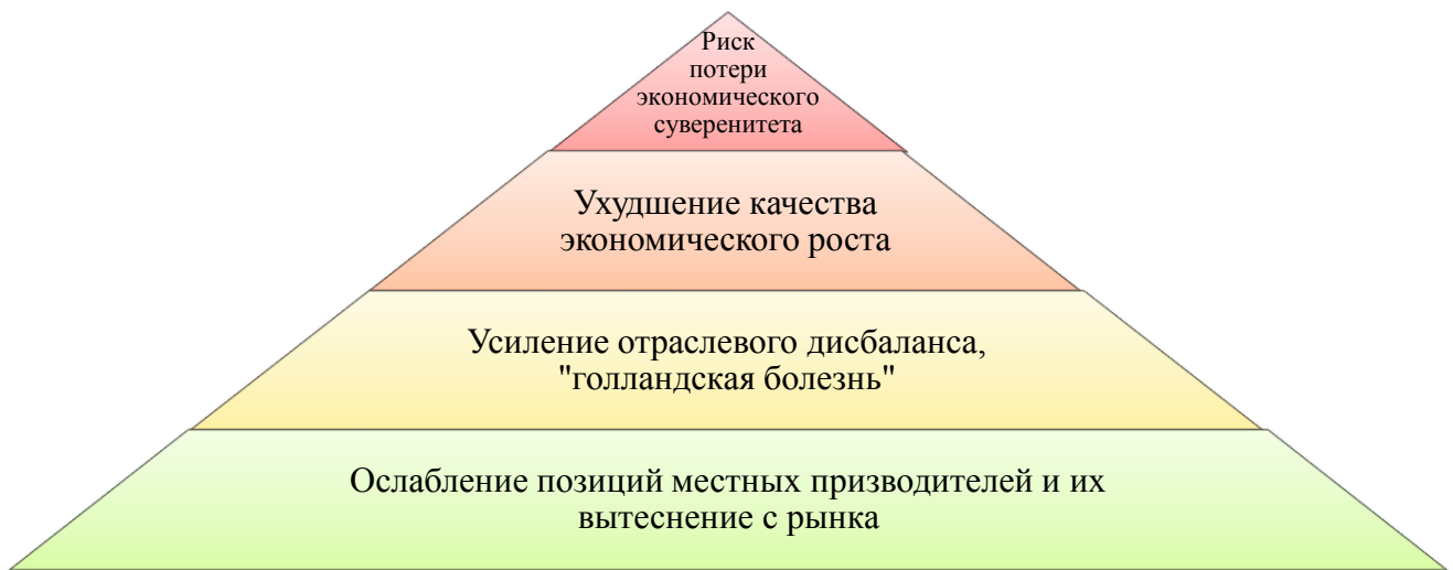
Рисунок 5 – Иерархия отрицательных экономических эффектов (рисков) иностранных инвестиций для экономики региона - реципиента