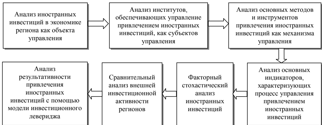
Рисунок 1 –Этапы методики проведения комплексного анализа иностранных инвестиций как объекта управления

Разработанная методика анализа иностранных инвестиций как объекта управления включает в себя 7 последовательно реализуемых этапов (рисунок 1).