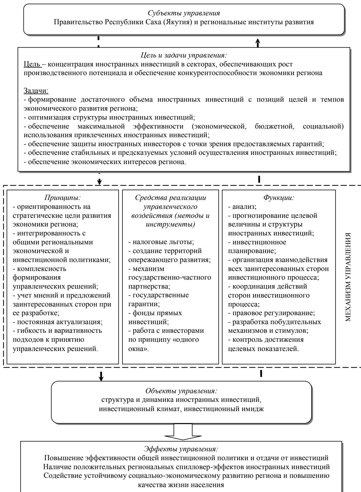
Рисунок 2 – Структурно-логическая модель организационно-экономического механизма управления привлечением иностранных инвестиций в экономику региона