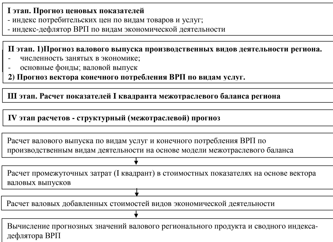
Рис. 3. Методика прогнозирования валового регионального продукта на среднесрочный и долгосрочный периоды

В результате анализа валового регионального продукта, с учетом выявленных особенностей развития экономики Республики Саха (Якутия) разработана методика прогнозирования валового регионального продукта, которая состоит из четырех взаимосвязанных этапов, представленных в виде схемы на рис. 3.