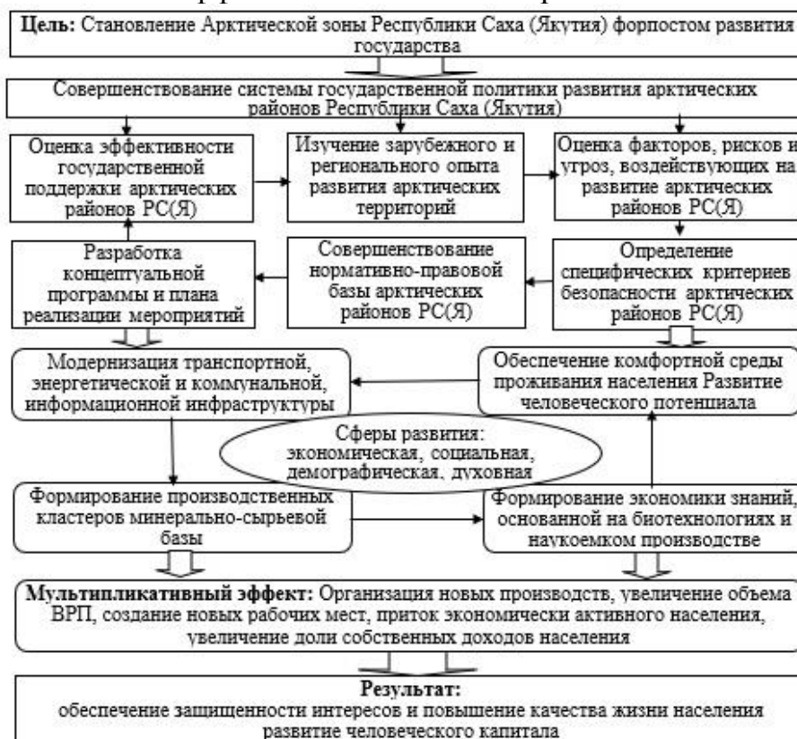
Рис. 2 – Модель социально-экономической безопасности населения Арктической зоны Республики Саха (Якутия)

На основе сформулированной системы государственного управления разработана модель социально-экономической безопасности населения Арктической зоны (рис. 2), отвечающая принципам единства, целостности, сбалансированности, взаимообусловленности и эффективности систем стратегического планирования.