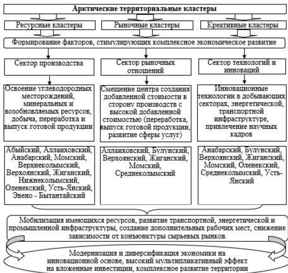
Рис. 3 – Функциональная схема территориальных отраслевых кластеров Арктической зоны

инфраструктуры; привлечение научных и технических кадров; создание особых экономических и технико-внедренческих зон.