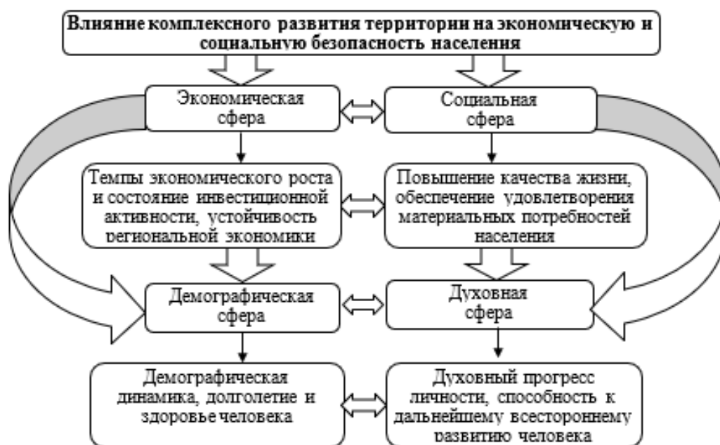
Рис. 5 – Влияние комплексного развития арктических районов на социально-экономическую безопасность населения

В диссертационной работе показаны направления влияния комплексного развития территории на обеспечение социально-экономической безопасности населения Арктической зоны (рис. 5). Реализация системообразующих проектов комплексного развития арктических территорий позволит стимулировать повышение эффективности и диверсификации экономики районов за счет средств инвесторов, реализующих проекты на данных территориях.