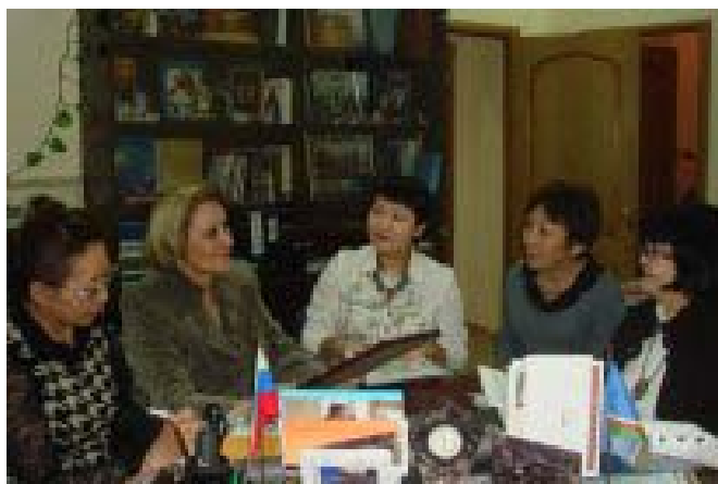
Заседание Московского отделения Лиги