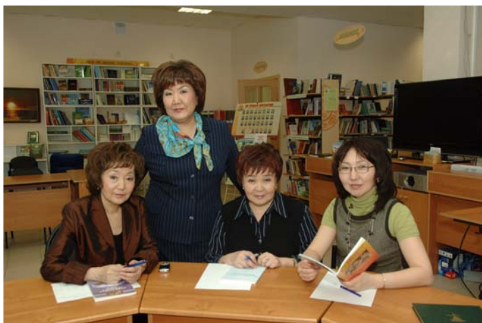
Якутская городская национальная гимназия