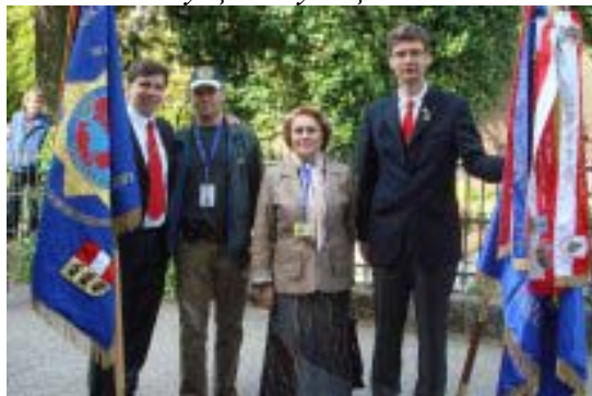
11-й Конгресс IPA стран Центральной и Восточной Европы 5-9 мая 2010 г.