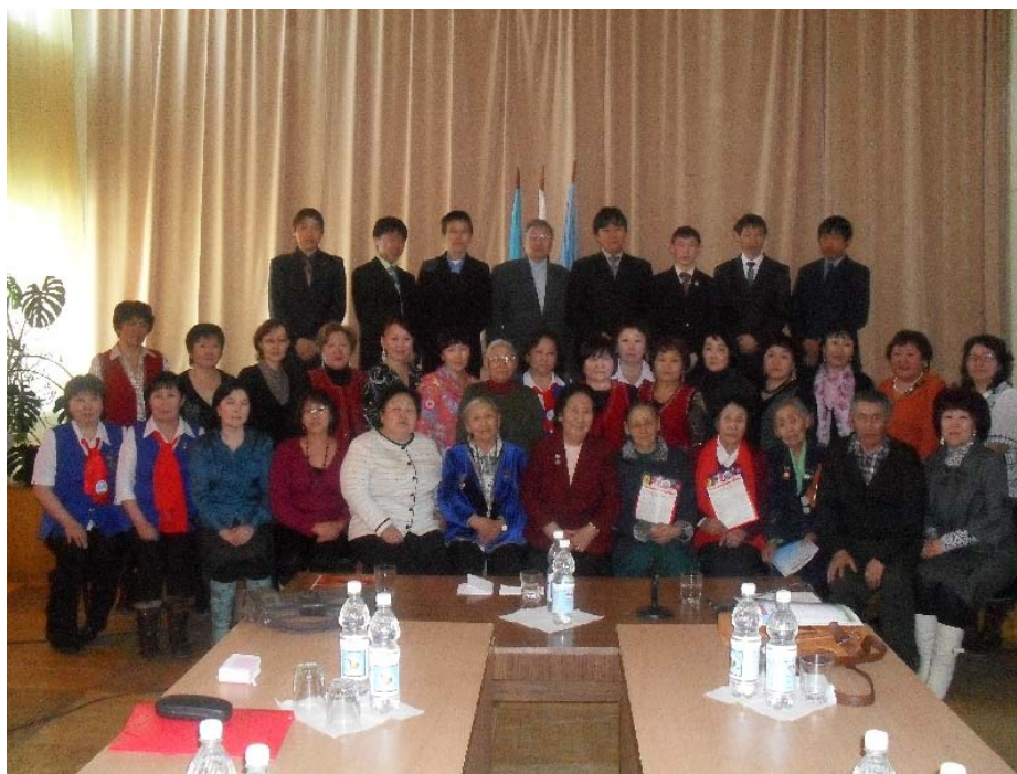
Встреча с ветеранами участников автопробега в п. Тюлях Усть-Алданского улуса