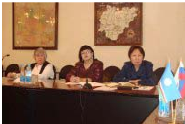
Круглый стол «Существующее общественное мнение о неблагоприятных слоях общества и формирование общероссийской информационно-аналитической программы по изменению существующего положения»