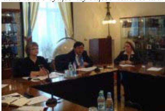
Круглый стол «Существующее общественное мнение о неблагоприятных слоях общества и формирование общероссийской информационно-аналитической программы по изменению существующего положения»