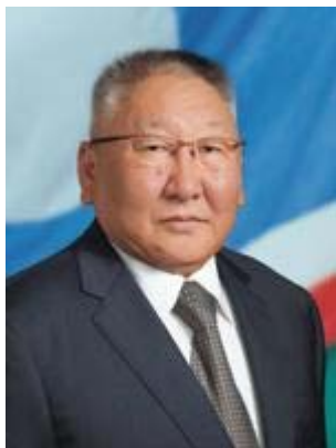
Президент Республики Саха (Якутия) Е.А.Борисов