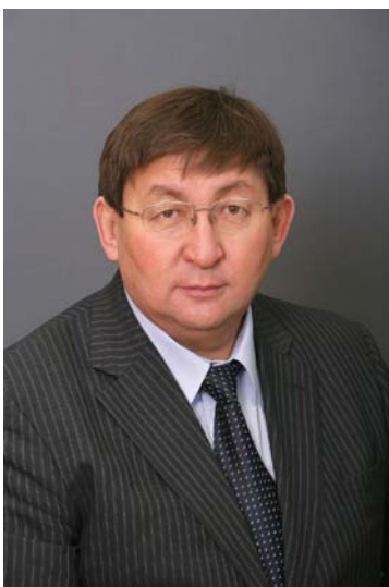
Министр науки и профессионального образования РС (Я) Ю.С. Куприянов