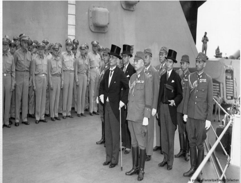
Делегация Японии на борту «Миссури» прибыла подписывать капитуляцию

Но война ещё не окончилась. На Ялтинской конференции руководителей СССР, США и Великобритании Советский Союз согласился вступить в войну с Японией, которая была сторонницей фашисткой Германии. Окончательно Вторая мировая война завершилась, когда на борту американского линкора «Миссури» 2 сентября был подписан акт о капитуляции Японии.