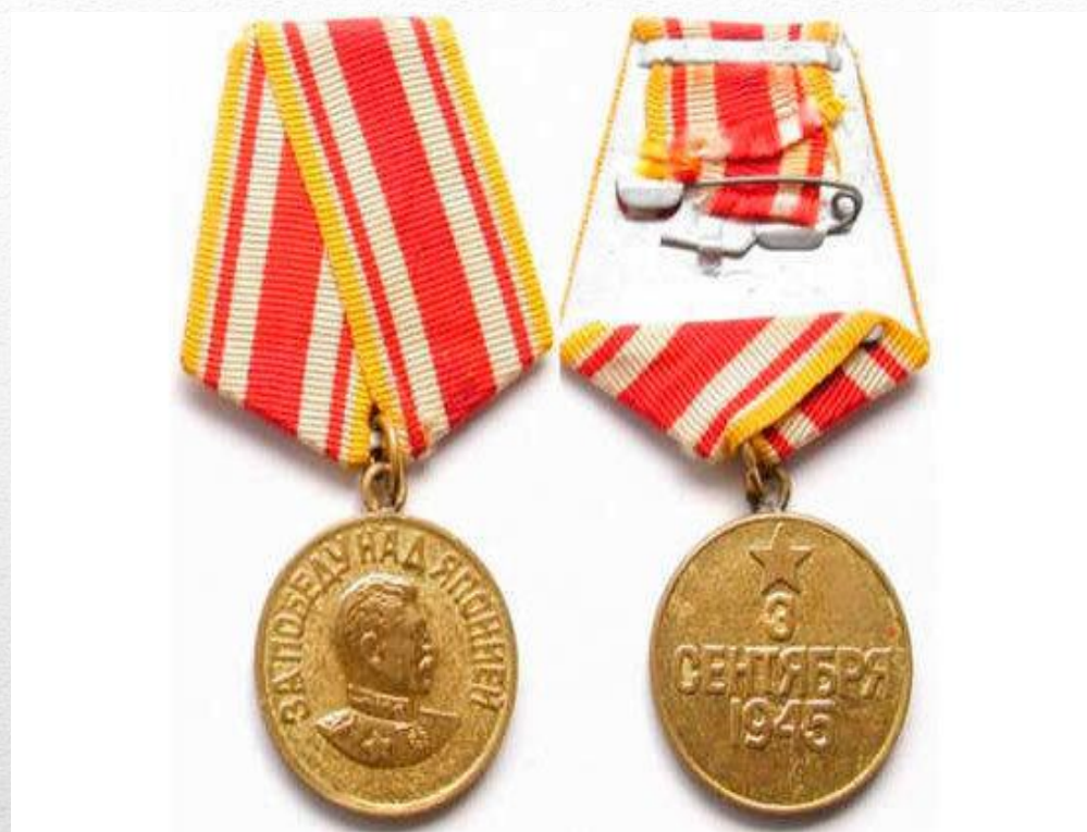
Медаль «За Победу над Японией»

В честь этого события в России отмечают день воинской славы России «3 сентября — День окончания Второй мировой войны». Раньше он приходился на 2 сентября, но в этом году вступил в силу закон сенаторов и депутатов Госдумы, который уточнил дату. Разработчики отмечают, что в СССР был принят указ об объявлении 3 сентября праздником Победы над Японией. Именно 3 сентября указано на медали «За победу над Японией», которой были награждены 1,831 миллиона человек.