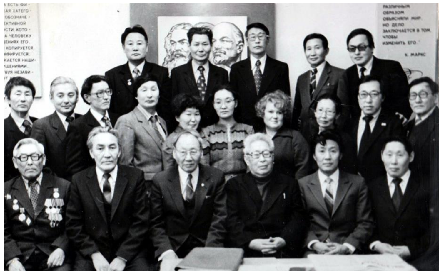
Кафедра философии и научного коммунизма ЯГУ