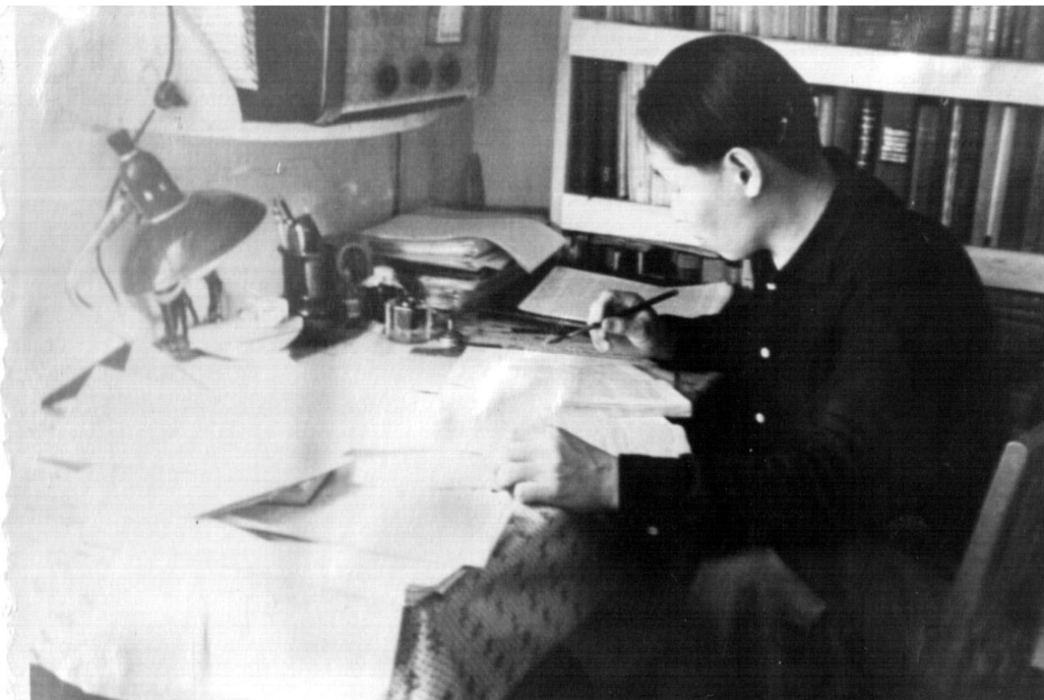
Студент исторического отделения ЯГУ