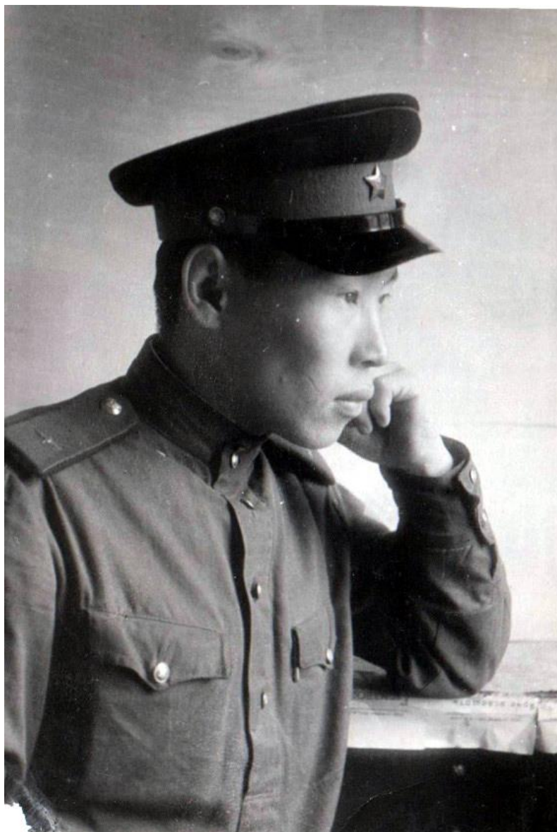
На службе в армии