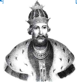
Князь Дмитрий I Александрович. Гравюра 1850 г.