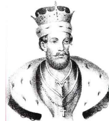
Князь Василий I Ярославич. Гравюра 1850 г.