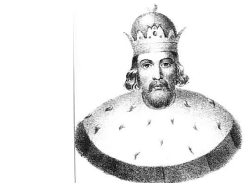
Князь Андрей III Городецкий. Гравюра 1850 г.