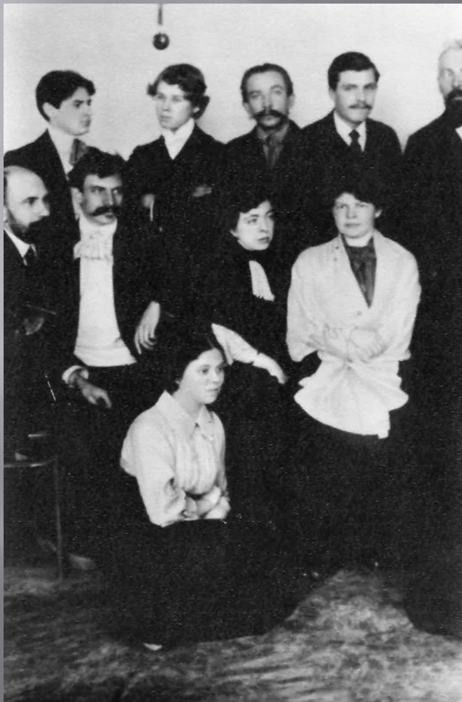
На фото: С. А. Есенин в группе работников типографии «Т-во И. Д. Сытина». 1914 г., Москва.