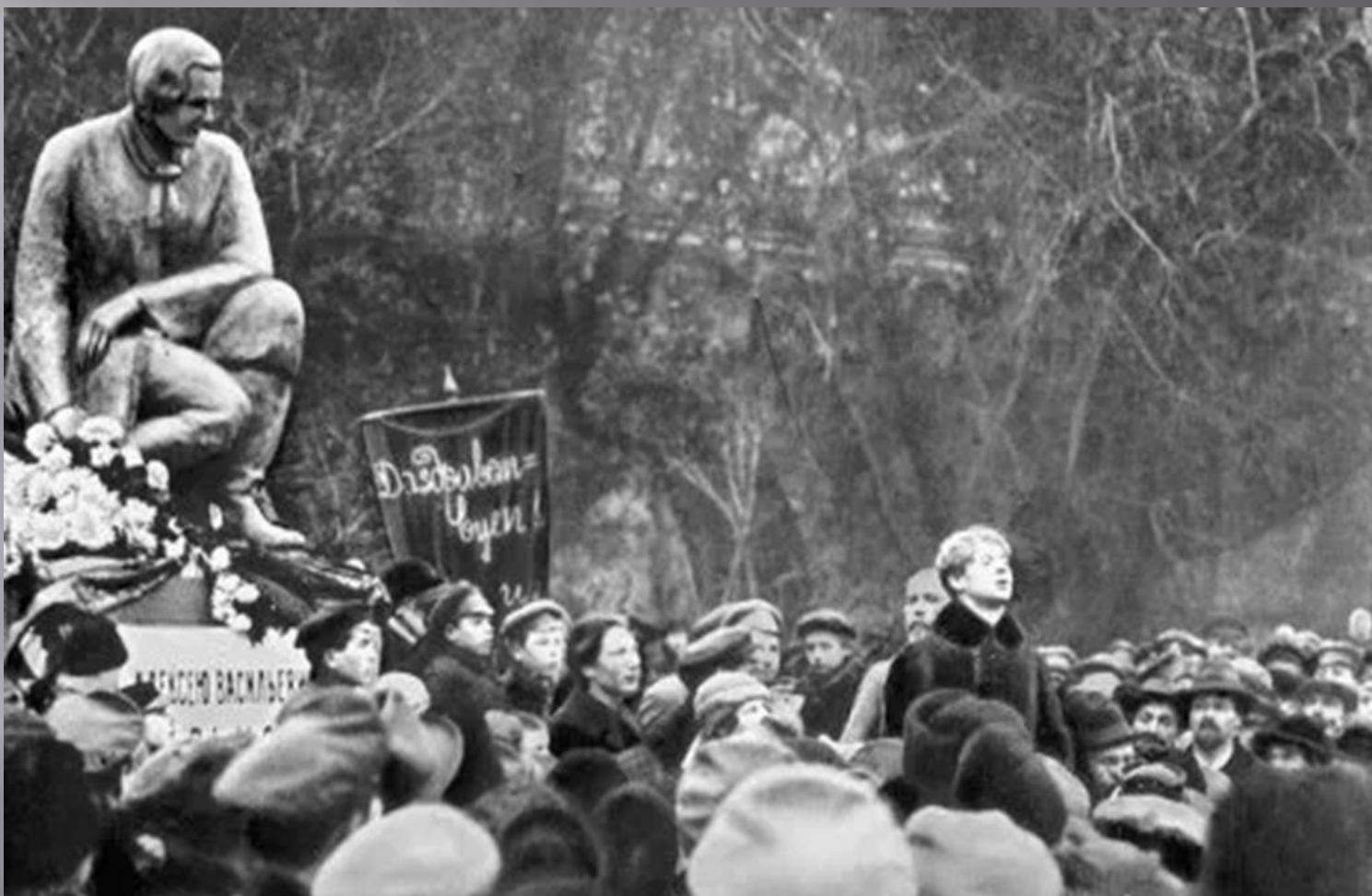
С. А. Есенин читает стихотворение "О, Русь, взмахни крылами..." на открытии памятника А. В. Кольцову. 1918 г., 3 ноября. Москва.