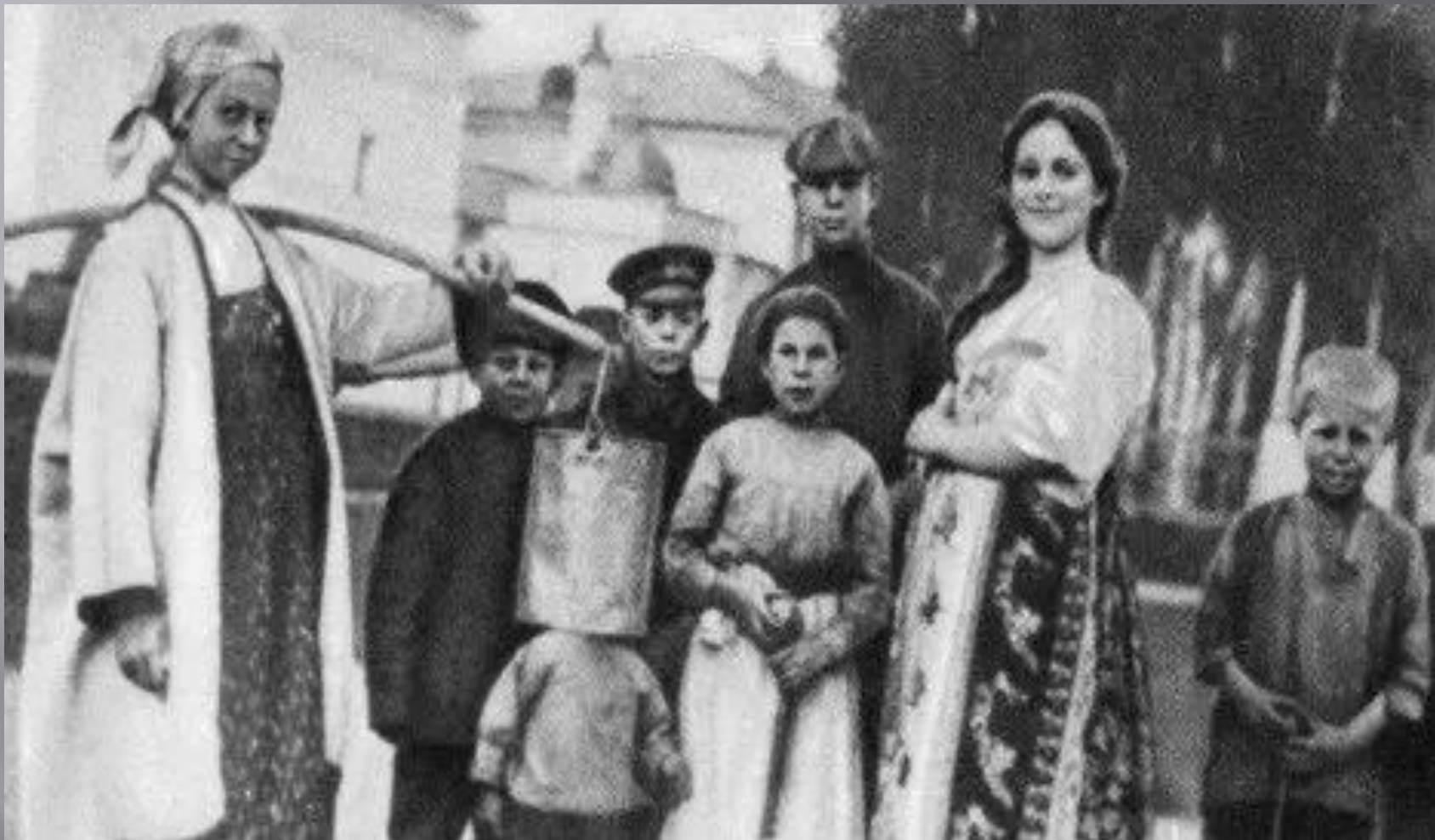
На фото: Сергей Есенин (3 справа) среди односельчан. 1909 год.