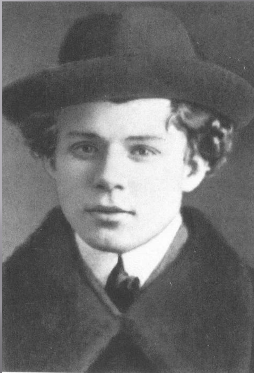
Сергей Есенин. Фото 1913 г.