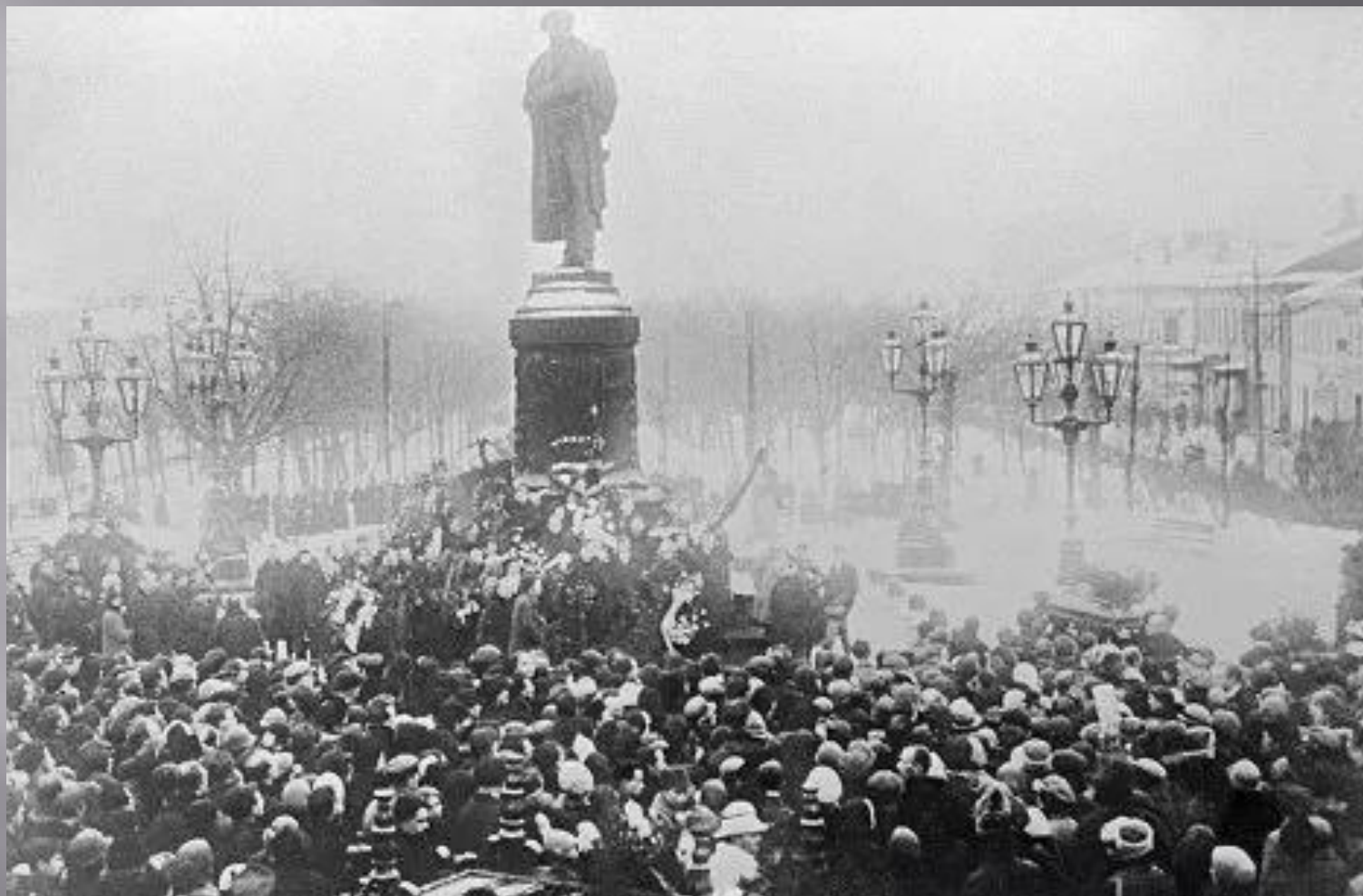
Сергея Есенина похоронили 31 декабря 1925 года на Ваганьковском кладбище в Москве. На фото: Похороны поэта Сергея Есенина.