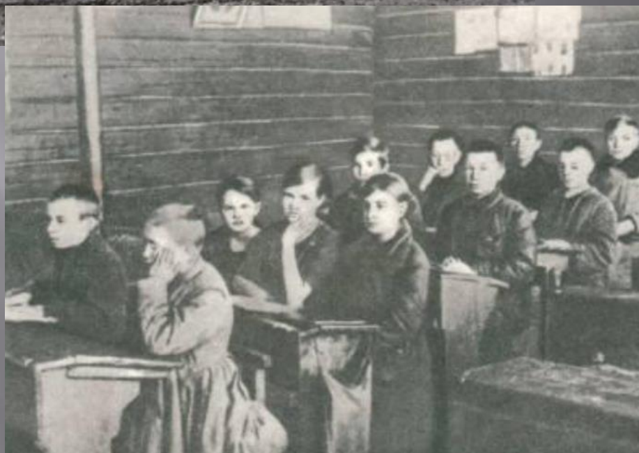
На фото: на занятиях в классе Константиновского земского училища (1904-1909 г.)