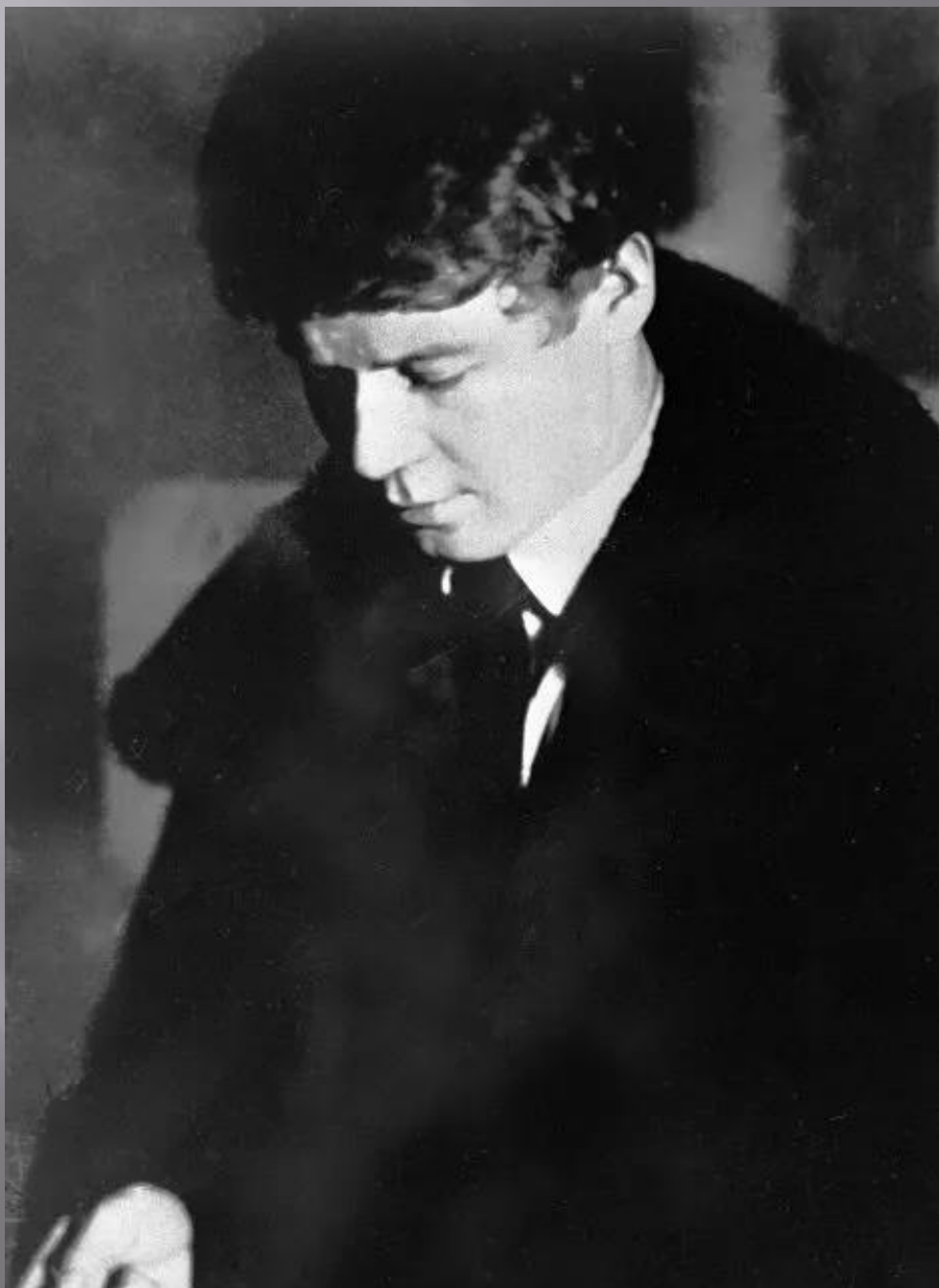
Сергей Есенин. Фото 1922 г.