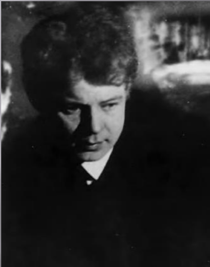
Сергей Есенин Фото 1924 г., Ленинград