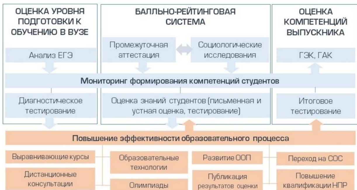
Рисунок. Внутривузовская система оценивания знаний студентов СВФУ