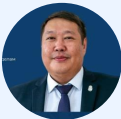
С.А. Хатылыков, зам. министра по внешним связям и делам народов РС(Я)