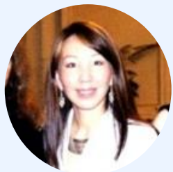
М.Н. Михайлова, первый секретарь Первого Европейского департамента МИД России