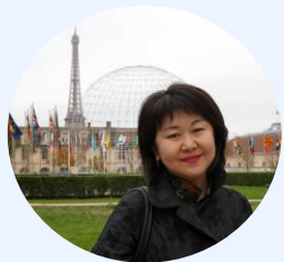
В.И. Сидорова, Представитель МИД РФ в Республике Саха (Якутия)