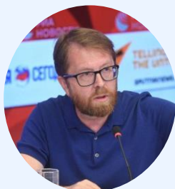
А.В. Геласимов, писатель, лауреат премии Национальный бестселлер