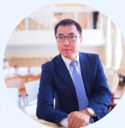
К.А. Борисов, Постоянный представитель РС(Я) по ДФО, Владивосток