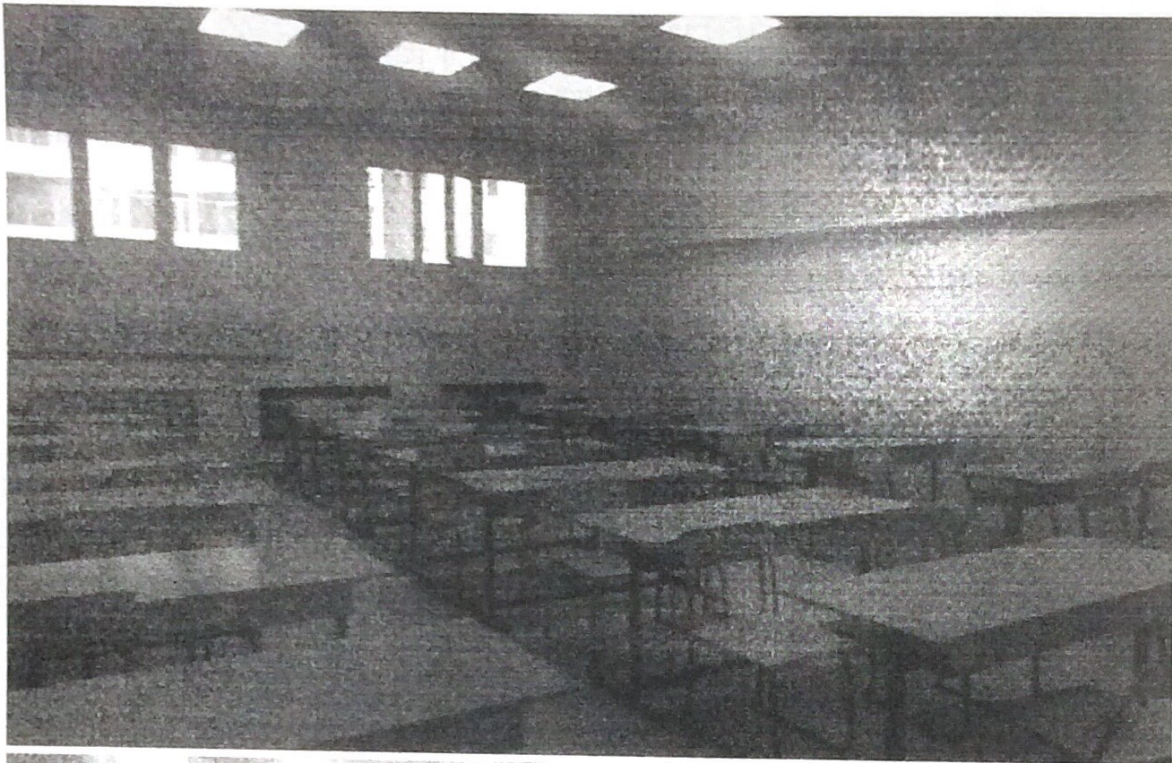
3. Фото учебной аудитории