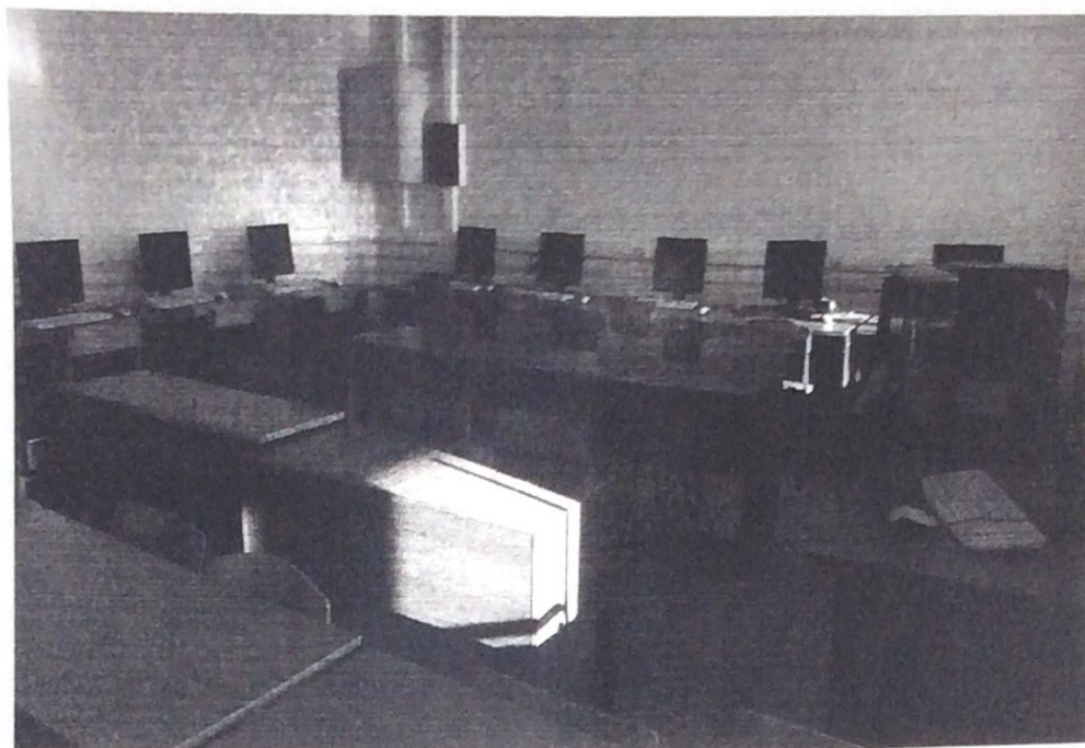
4. Фото учебной аудитории