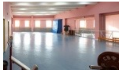
Зал аэробики КФЕН