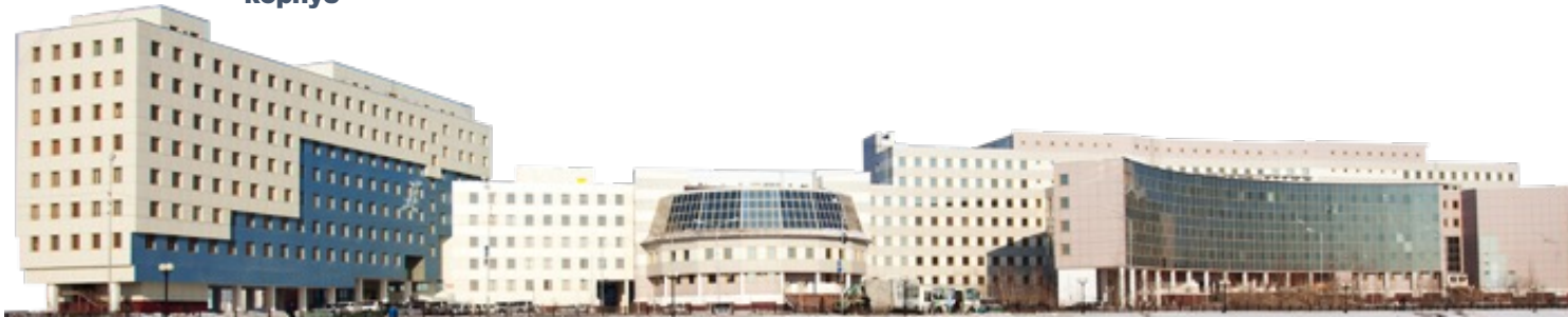
Корпус технических факультетов