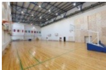
Зал игровых видов спорта КФЕН