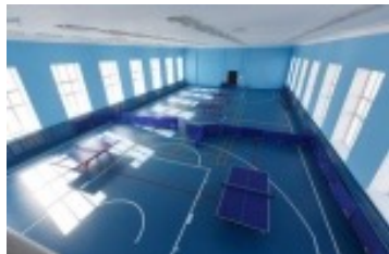
Спортивный зал ГУК