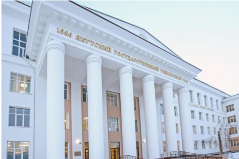
Главный учебный корпус