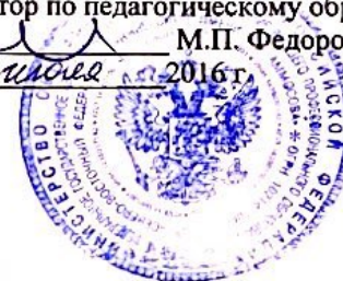
График учебного процесса на 2016-2017 учебный год студентов заочной формы обучения Педагогический институт